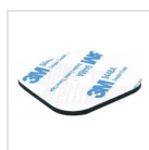
Calamita di fissaggio