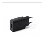
Alimentatore USB 5Vdc 1A