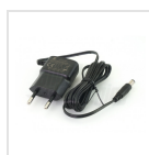
Alimentatore 5Vdc 1A