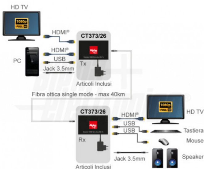
Collegamento 1:1 - Switch in cascata