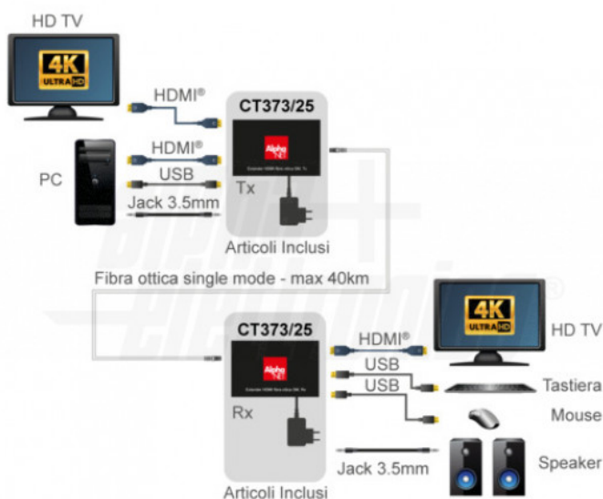
Collegamento 1:1 - Switch in cascata