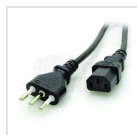
Cavo ingresso con spina Italia