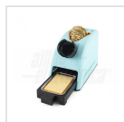
Calamaio porta Stilo saldante