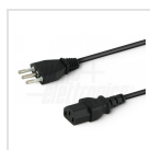
Cavo ingresso con spina Italia