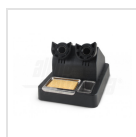
Calamaio porta stilo e pompeta dissaldante