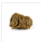
Paglietta pulisci punte