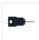
ø2,35mm - ø0,7mm