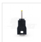
ø2,35mm - ø0,7mm