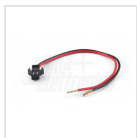
Cavetto con connettore - 15cm