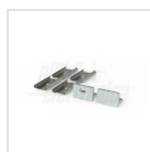
Terminali di chiusura e graffette di fissaggio