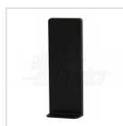
Staffa a muro magnetica