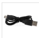
Cavo di alimentazione USB