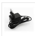
Alimentatore 5Vdc 1A