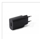
Alimentatore USB 5Vdc 1A