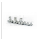
Calamite di fissaggio