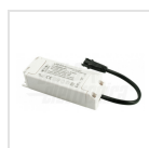
Alimentatore 460mA corrente costante