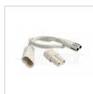
Set connettore e cavo per collegamento in serie