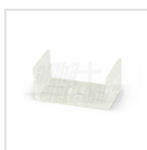
Ganci di fissaggio