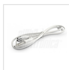
Cavo di alimentazione con spina 2 poli