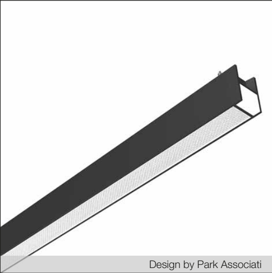
Design by Park Associati