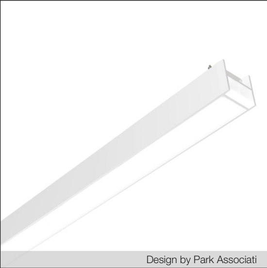
Design by Park Associati