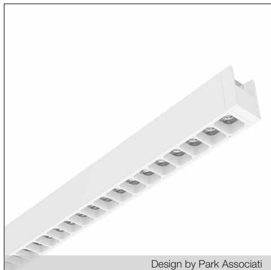
Design by Park Associati