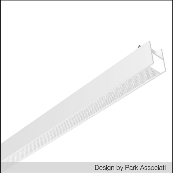
Design by Park Associati