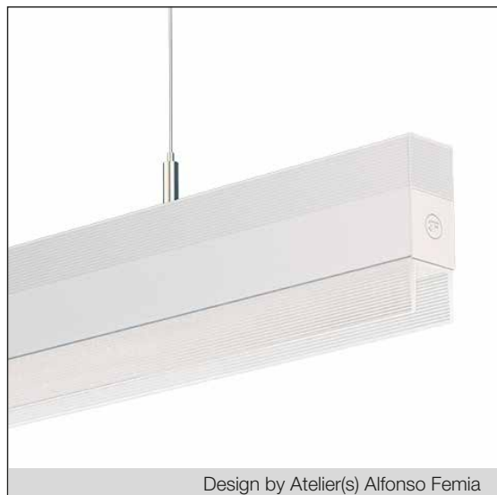
Design by Atelier(s) Alfonso Femia